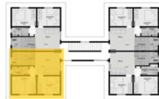
LEIPLUT - TOMAU ALLOUËL - SÃO JORGE E LARANJEIRAS (2006)